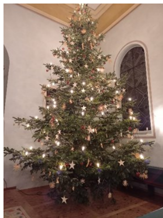
Text & Bild: Lisa Kelting

Wer etwas passendes abgeben möchte, melde sich bitte zeitnah beim Pfarramt, Tel. 08454/2999.